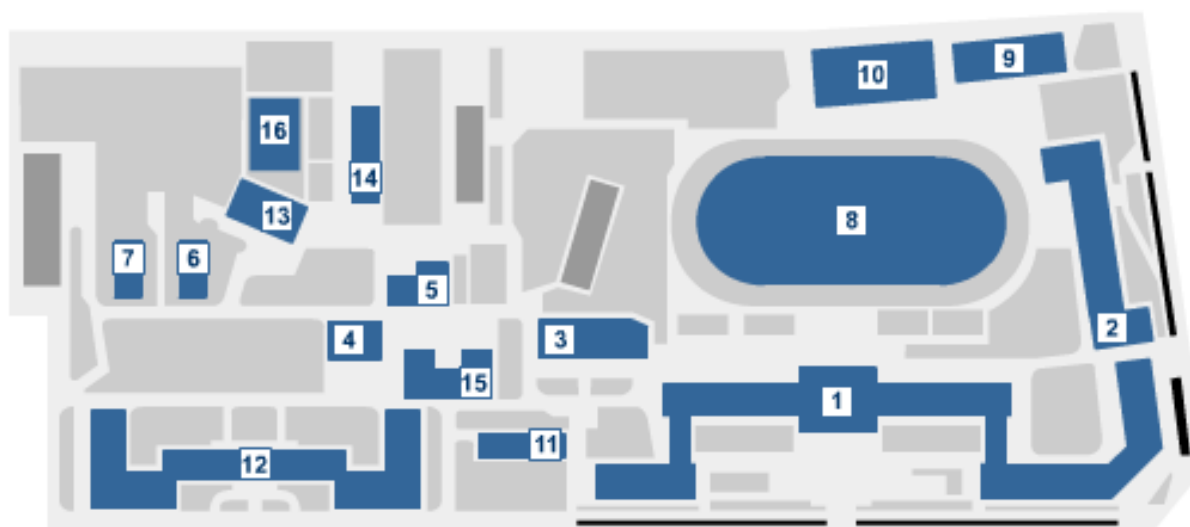
Схема университетского комплекса