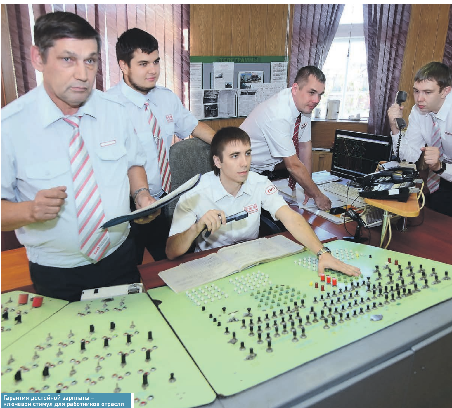
Гарантия достойной зарплаты - ключевой стимул для работников отрасли

С 1 октября 2016 года заработная плата в отрасли будет проиндексирована. Повышение коснётся как работников ОАО «РЖД», так и служащих отраслевых учреждений здравоохранения и образования.