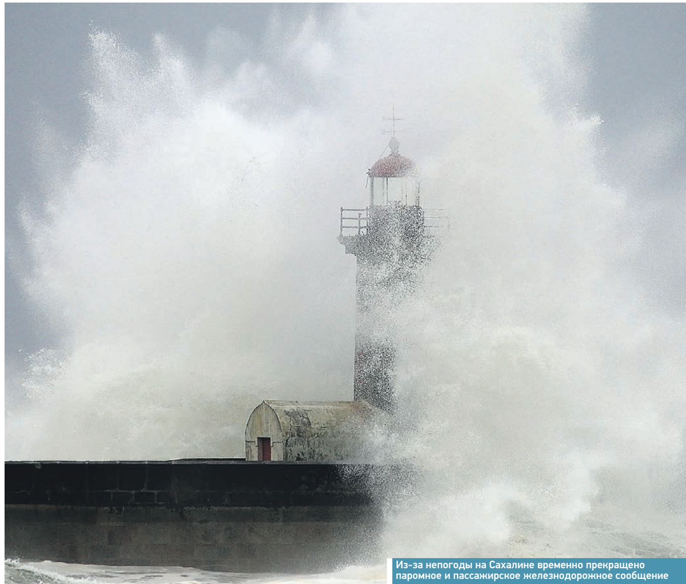
Из-за непогоды на Сахалине временно прекращено паромное и пассажирское железнодорожное сообщение

На восстановительные и укрепительные путевые работы на Сахалинской магистрали мобилизовали все силы