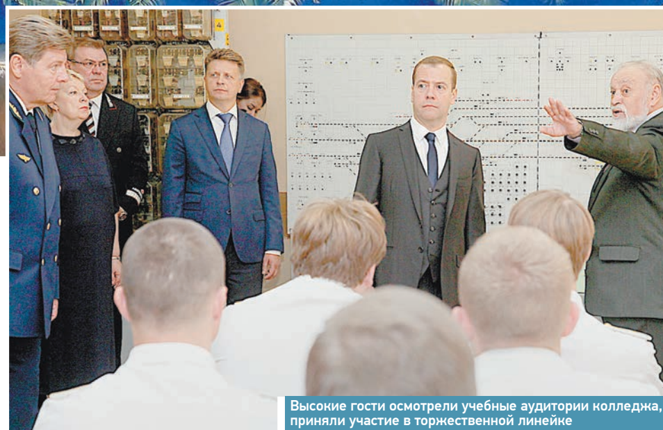
Высокие гости осмотрели учебные аудитории колледжа, приняли участие в торжественной линейке

При подготовке специалистов для конкретной работы на железной дороге особое значение имеет практическая направленность подготовки ребят. Это так. С другой стороны, приходящие сюда 15-летние юноши и девушки только-только делают в жизни первые самостоятельные шаги. Помочь им в этом, сделать всё, чтобы постепенно, шаг за шагом сформировать у них практические компетенции, инновационное мышление, творческую и профессиональную инициативу – такую задачу ставит перед собой каждый из 150 преподавателей колледжа. Когда-то спецов для железнодорожной отрасли штамповали, и дело было поставлено на поток, теперь без способности чутко реагировать на запросы производителей ни одно из средних профессиональных учебных заведений поставленных перед ними задач