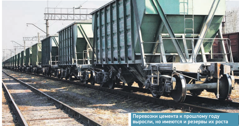
Перевозки цемента к прошлому году выросли, но имеются и резервы их роста

В разрезе дорог следует отметить Октябрьскую магистраль, где в августе были