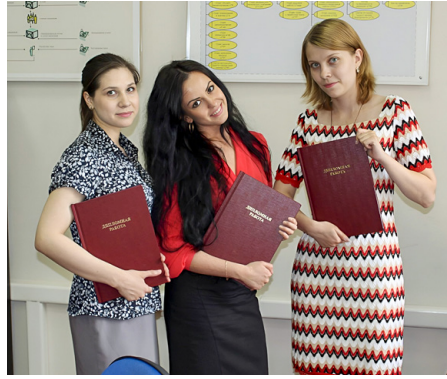
Дипломы распечатаны. Защита впереди. Первый набор бакалавров