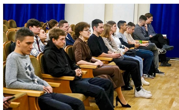
Студенты увидели документальные кадры, услышали рассказы людей Донбасса, и они опровергают фейковые измышления о происходящем в зоне СВО и ее причинах