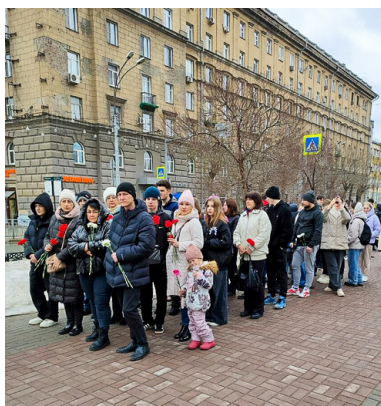
Студенты, преподаватели и сотрудники СГУПСа в этот день несли цветы к стихийному мемориалу...