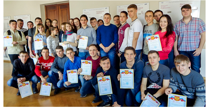
«Оборонка» состоялась: факультет благодарит своих студентов за участие. 2017 год

– Очень хорошо помню. Такое остается на всю жизнь! Но это давняя история, так как я окончил вуз в 1974 году. Тогда была другая страна, другая система образования. Но мы были такими же молодыми, как вы сейчас. Ездили в стройотряды, занимались наукой, спортом, весело проводили время. Это не забывается!