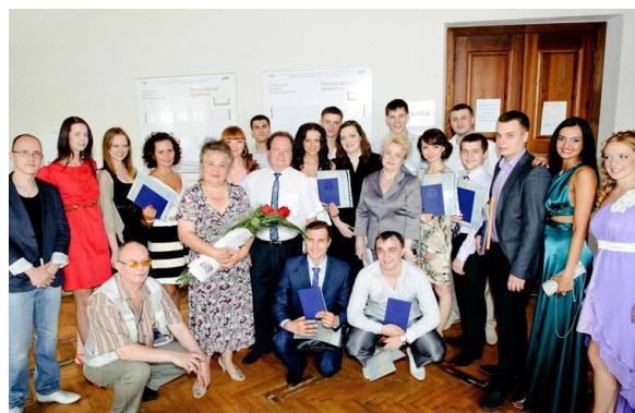
Наши выпускники, 2012 год