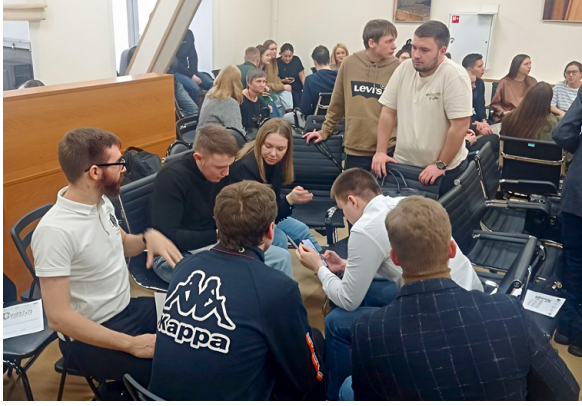
Встреча проходила в непринужденной обстановке