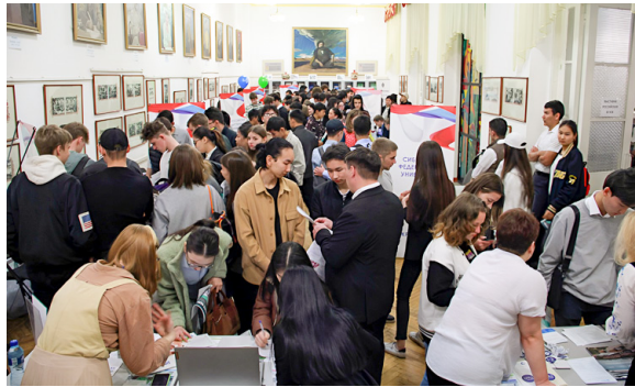
35 российский вузов от Калининграда до Хабаровска участвовали в выставке, но у стенда СГУПС всегда было многих желающих узнать как можно больше о нашем университете

Во время работы выставки учащиеся Кыргызстана активно знакомились с актуальными и востребованными