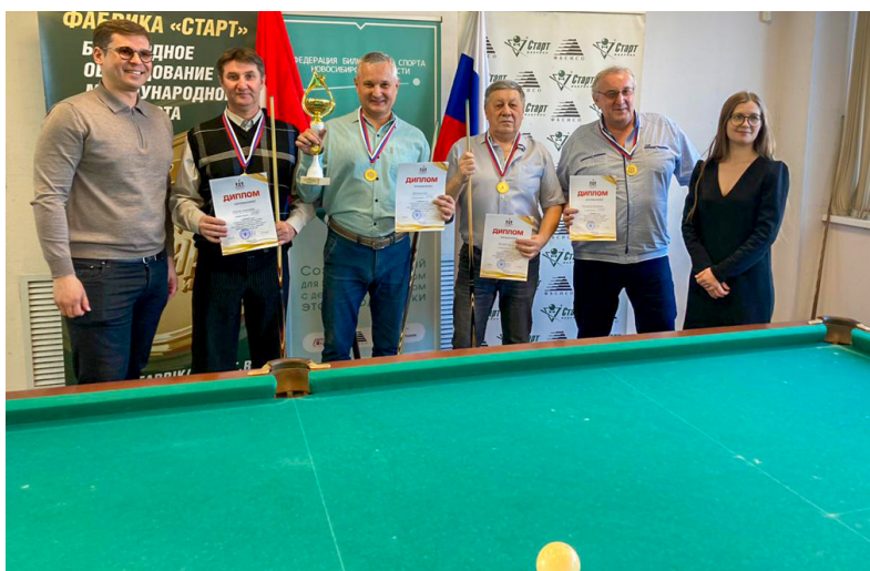
Команда ППС СГУПСа – чемпионы по бильярду