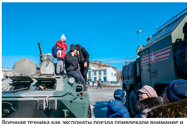
Военная техника как экспонаты поезда привлекали внимание и взрослых, и детей