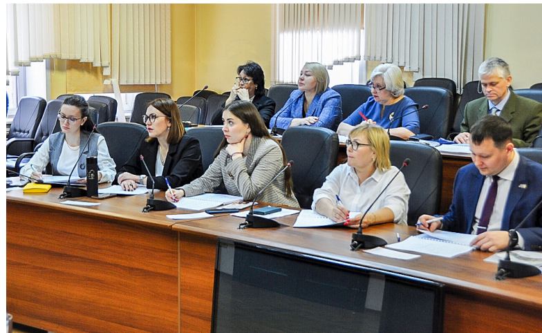
Комиссия внимательна: идет знакомство с завтрашним днем компании