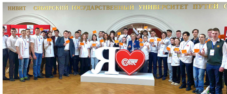
Участники профильной смены «Перспектива 2.0» выбирают СГУПС!