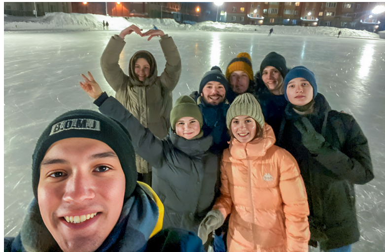
О своих однокурсниках могу сказать одно: я их обожаю!