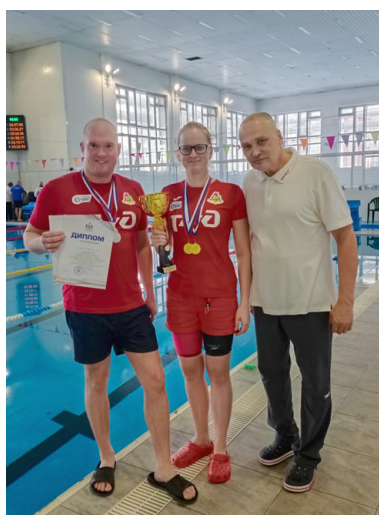
Победители в плавании из СГУПСа