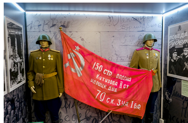
Главный экспонат – точная копия Знамени Победы