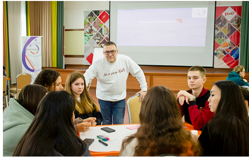
На проекте рождались... проекты

Местом проведения стала база ЦСПМиО имени К.С. Заслонова, находящаяся за городом, что позволило участникам отдохнуть от городского шума и проникнуться красотой заснеженного соснового бора. В мероприятии приняли участие 34 представителя из 17 вузов Новосибирска, которые не только прослушали образовательные лекции и приняли участие в стратегических сессиях, но и поработали в командах, разрабатывая проект-решения работы своих ССУ.