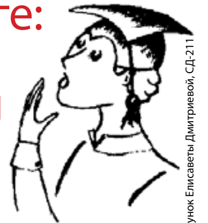
Рисунок Елисаветы Дмитриевны, СД-211

1 ДУРШЛАГ. Слышится то ли «дуршлаг», то ли «друшлаг», поэтому довольно многие делают ошибку. Проверить, как правильно, очень легко: достаточно вспомнить, что это немецкое слово, образованное от предлога durch, что значит «через, насквозь», и schlagen – «пробивать».