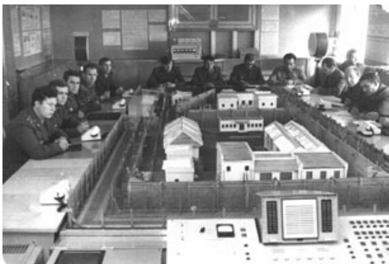
Подготовка к командировке в Москву, на Олимпийские игры