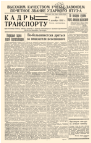
Первый номер газеты «Кадры – Транспорту»