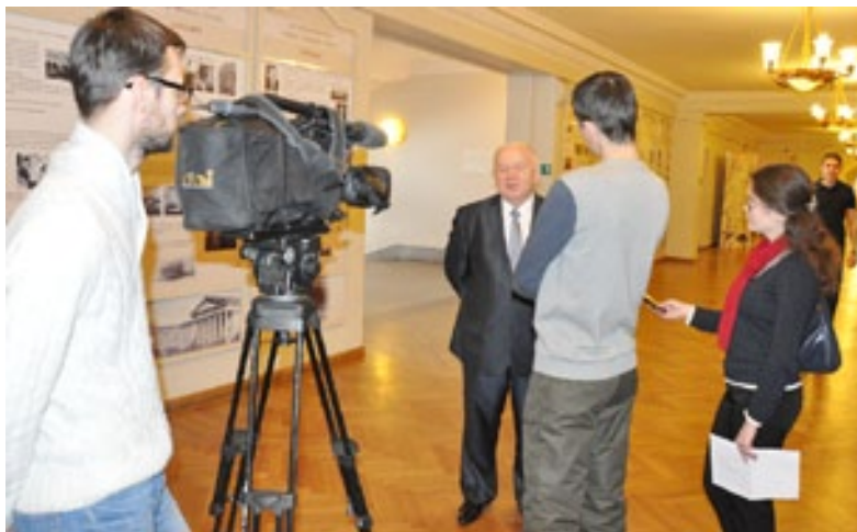
Работу конференции освещал ряд региональных СМИ