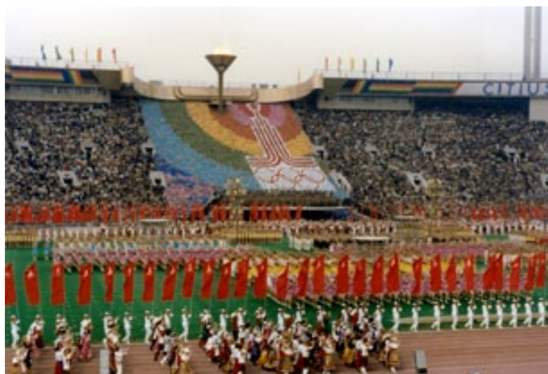
Бывает, что кому-то надо брать в руки автомат, чтобы для других праздник не был ничем омрачен