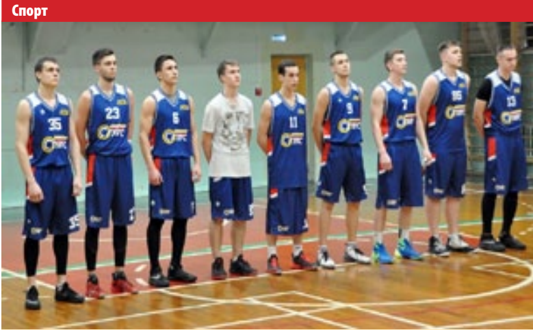
Команда СГУПСа готова к борьбе за высокие места