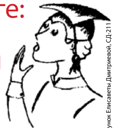
Рисунок Елисаветы Дмитриевой, СД-211

1 ДУРШЛАГ. Слышится то ли «дуршлаг», то ли «друшлаг», поэтому довольно многие делают ошибку. Проверить, как правильно, очень легко: достаточно вспомнить, что это немецкое слово, образованное от предлога durch, что значит «через, насквозь», и schlagen – «пробивать».