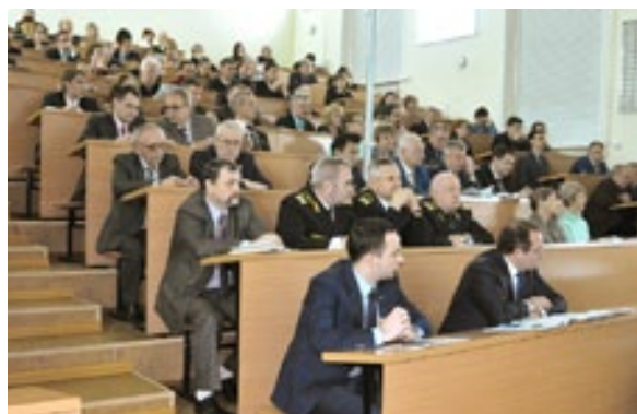
На расширенном ученом совете были подведены итоги научно-исследовательской работы за 2016 год и поставлены задачи на 2017-й