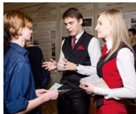
На вопросы пришлось отвечать и студентам