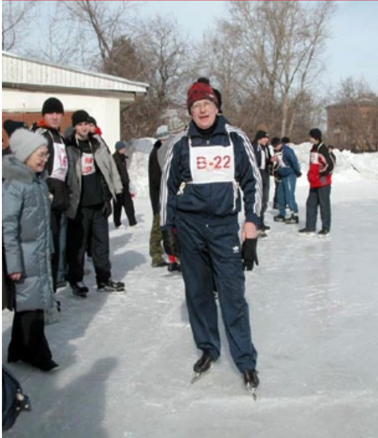
Поздравление с Новым годом от деканата УТТК