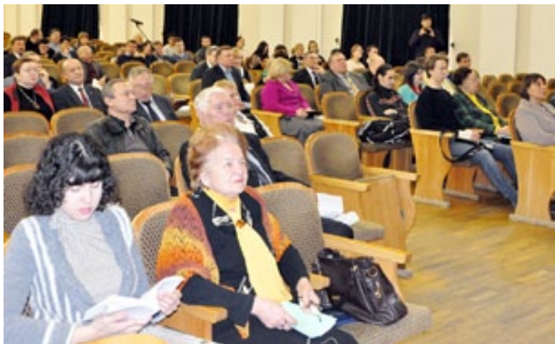
Участники конференции – ученые и руководители различных компаний