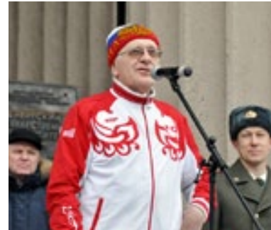
Рано вешать коньки на гвоздь