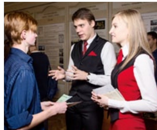
На вопросы пришлось отвечать и студентам