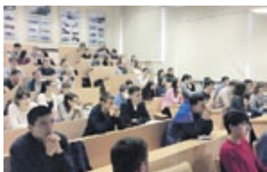
Во время встречи...

В течение 9 часов было убрано и вывезено более 1,1 тысячи кубометров снега. В ходе работ был также расчищен участок от улицы Урицкого в сторону Сибирского государственного университета водного транспорта. Ранее железная дорога уже принимала участие в уборке снега на Вокзальной магистрали и улице Урицкого. Кроме того, 29 декабря 2016 года в расчистке данных улиц принимали участие более 100 работников управления Западно-Сибирской магистрали.