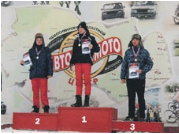
Пьедестал становится привычным местом для наших автогонщиков