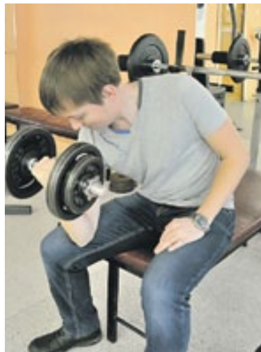
Тренажерная комната в общежитии №3 появилась как раз по просьбе студентов