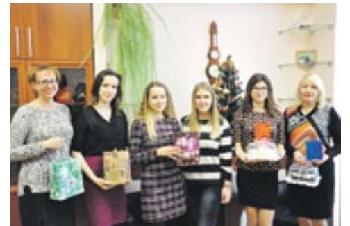
Победители и призеры конкурса стенгазет