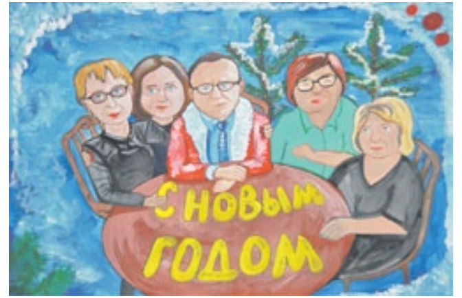
Поздравление с Новым годом от деканата УТТК