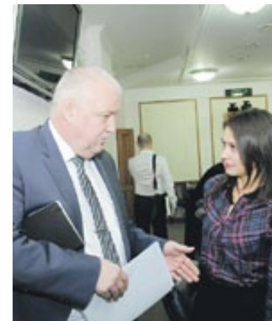
Заинтересованный разговор с представителями ЗСЖД продолжался и в кулуарах