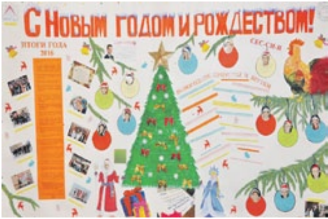
Стенгазета ПГС признана лучшей