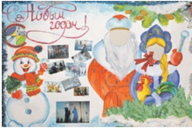
Студенты СЖД придумали, как каждый может побыть Дедом Морозом