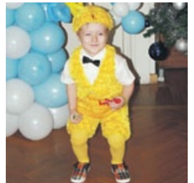
Утренник в СГУПС – отличный новогодний праздник для детей!