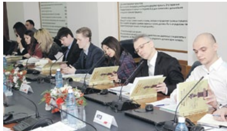
Участникам встречи презентовали книгу «Стальная магистраль», подготовленную к 120-летию Западно-Сибирской железной дороги