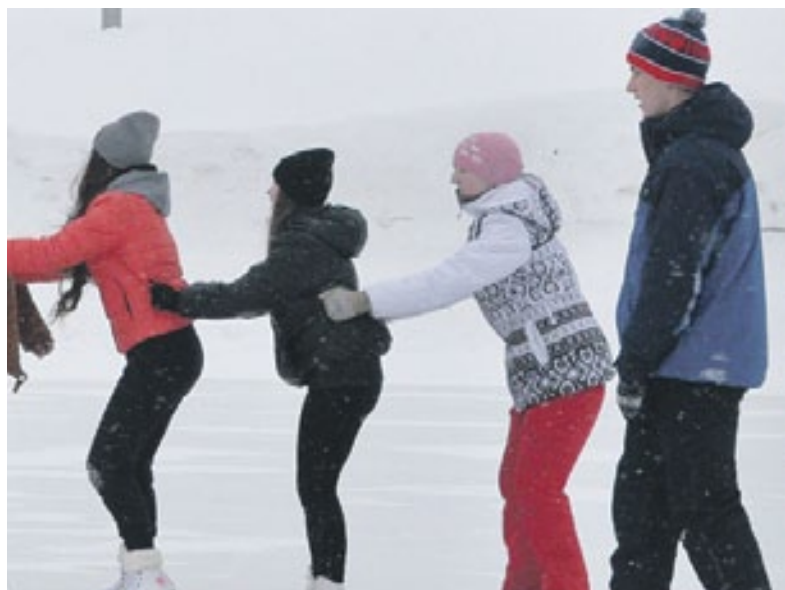
Катались кто как мог и хотел