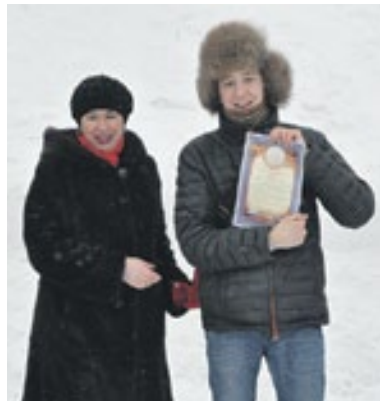
Наиболее отличившимся – награды

нования на катке и от того, что я вообще отмечаю День студента! Мне еще учиться в ЦДО, но в будущем собираюсь поступать в СГУПС.