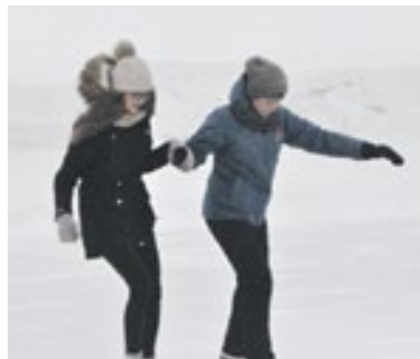
На каток вышли все: и кто с коньками на ты, и кому нужна помощь друга

– У меня остались только положительные впечатления от празд-