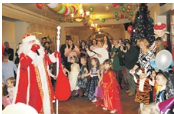
Дети сотрудников вуза повидали на празднике и Деда Мороза со Снегурочкой и даже Бабу Ягу