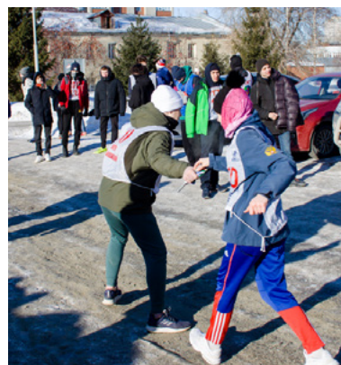
Принял палочки и – вперед!