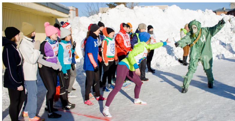
Не бойся: я свой – руку протяни!