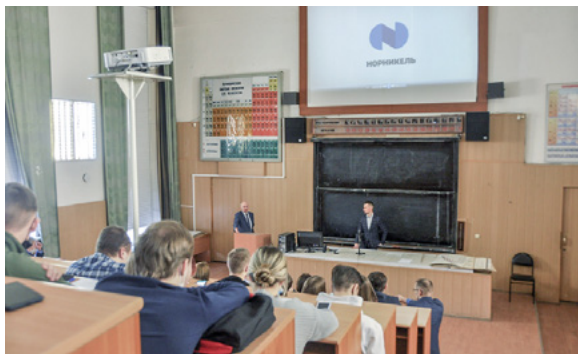
Разговор с представителями «Норильского никеля» проходил в разных аудиториях: студенты «разбились» по интересам