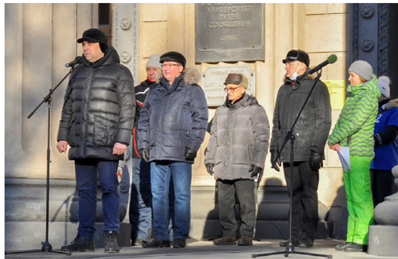
Ректор всем желает успеха и честной, бескомпромиссной борьбы