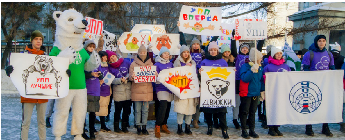
Победители конкурса болельщиков учатся на УПП!