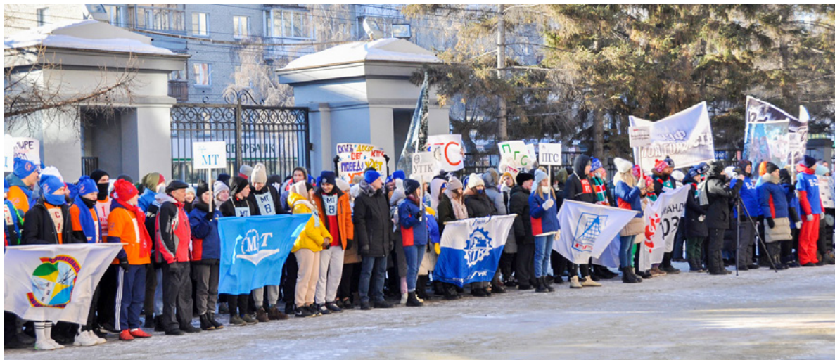
Парад участников объединяет всех – и участников эстафеты, и болельщиков