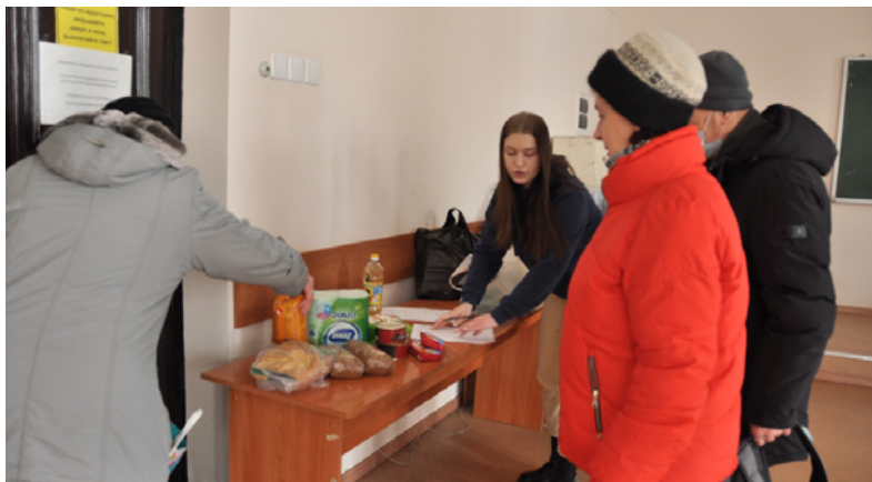
Ветераны приносили для беженцев и теплые вещи, и средства гигиены, и продукты питания – сахар, крупы, консервы, тушенку, подсолнечное масло...