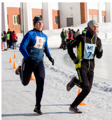
Первое правило – обгони впереди бегущего!

Но, повторимся, остается в ней главное: верность традициям НИВИТа-НИИЖТа-СГУПС.