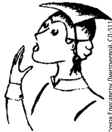
Рисунок Елисаветы Дмитриевой, СД-511

«Я одолжил у него пару сотен на покупку билетов». «Я занял у него пару сотен на покупку билетов». Есть ли разница между этими предложениями? На первый взгляд – нет: не было у человека денег, он попросил у приятеля. Однако это только на первый взгляд. На самом деле первое предложение грамматически неправильно: нельзя «одолжить денег у