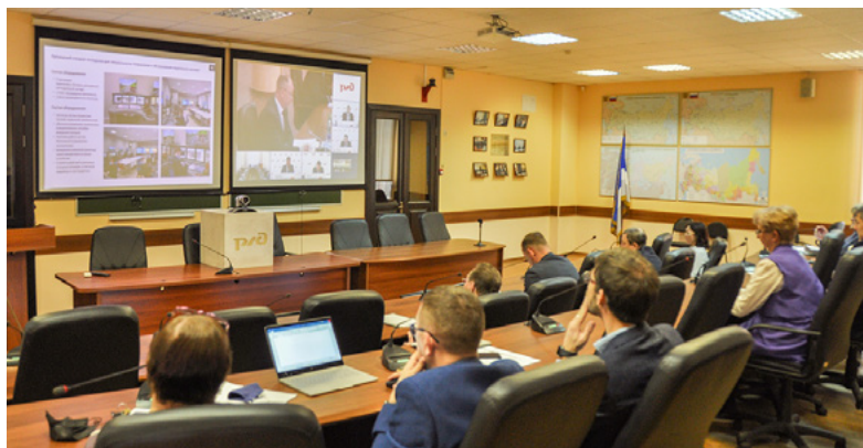
Участниками подписания Соглашения в режиме онлайн стали сотрудники университета