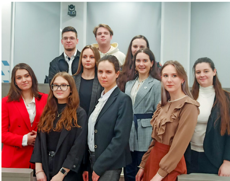
Студенты секции «Гуманитарные и социально-экономические науки»