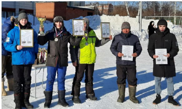
Лучшим картингистам – призы и дипломы

После завершения оборонно-спортивной эстафеты 13 марта на катке прошли традиционные соревнования по ледовому картингу «Кубок ректора СГУПС».