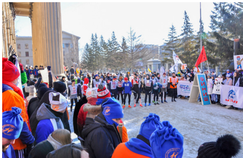
Еще несколько минут и раздастся стартовый выстрел!

Уже более 80 лет наше учебное заведение традиционно проводит оборонно-спортивную эстафету. И ни мороз, ни ветер, ни пандемия не в силах противостоять стремлению наших спортсменов и болельщиков не просто показать свои лучшие результаты и победить, а продолжить своим участием развивать традиции студентов, сотрудников и преподавателей НИВИТа-НИИЖТа-СГУПС.