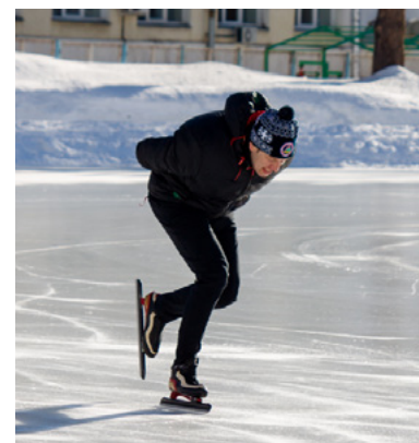
По льду быстрее, чем по снегу