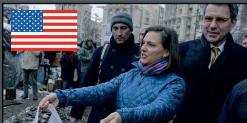
Виктория Нуланд, помощник государственного секретаря США по делам Европы и Евразии на Евромайдане

Евромайдан - организованные при поддержке и участии западных стран массовые беспорядки (ноябрь 2013 - февраль 2014), кульминацией которых стал антиконституционный кровавый переворот в Киеве, в ходе которого был незаконно отстранен легитимно избранный президент Украины и к власти пришел неонацистский режим, развязавший гражданскую войну*.