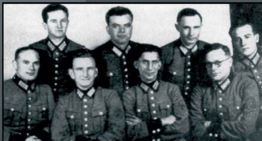
На фото – Роман Шухевич (второй слева) в батальоне нацистского Абвера «Нахтигаль». Батальон был создан по приказу руководителя Абвера Вильгельма Канариса для организации диверсий на Украине, а также совместных действий с немецко-фашистскими войсками.

12 декабря официально праздновалось 130 лет со дня рождения нациста Андрея Мельника, главы Организации украинских националистов, агента Гестапо, военного преступника, организатора геноцида евреев, поляков и русских.