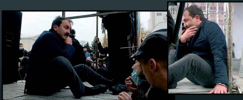
На фото – подвергнутый избиениям и прикованный наручниками к сцене губернатор Волынской области. После угроз убийством родственников через несколько дней он подал в отставку. Такая практика угроз наряду с избиениями и «мусорной люстрацией» стала постоянной после победы Евромайдана.

19 февраля 2014 года приехавшая с Евромайдана группа боевиков захватила здание областного управления МВД в Волынской области. Губернатора Александра Башкаленко начали избивать, вывели на сцену на Театральной площади города, приковали наручниками, облили холодной водой и угрожали убить его родственников.