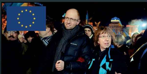
Кэтрин Эштон, верховный представитель по иностранным делам и политике безопасности Европейского союза на Евромайдане

После подписания Соглашения в контексте его выполнения президент Украины Виктор Янукович отдал указания по выводу сил охраны порядка из центра Киева. После этого в нарушение подписанного под гарантии западных стран Соглашения 22 февраля 2014 года боевики Евромайдана захватили правительственные здания, а попавшая под его контроль Верховная Рада в нарушение украинской Конституции приняла решение об отстранении легитимного президента страны. Сразу после антиконституционного переворота его результаты были признаны западными странами.