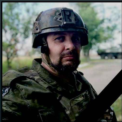
На фото – российский журналист Владлен Татарский (Максим Фомин)

27 октября 2023 года в Ялте был совершен террористический акт – покушение на бывшего депутата Верховной Рады, бывшего кандидата в Президенты Украины Олега Царева. В него было произведено несколько выстрелов из пистолета. Был задержан соучастник покушения на Царева, который дал признательные показания о своей работе на украинские спецслужбы.