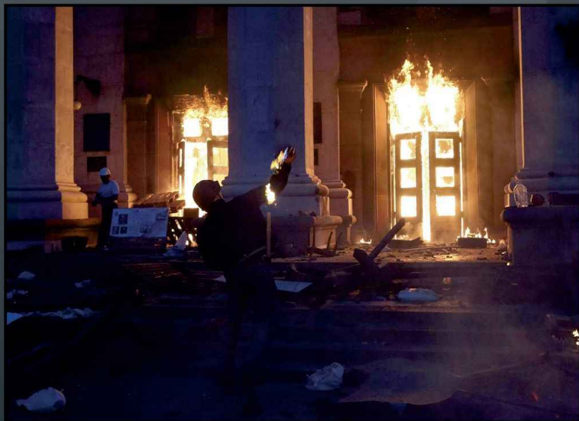
На фото – боевики Евромайдана поджигают одесский Дом профсоюзов, в котором были сожжены те, кто выступил против переворота на Украине

Одним из первых таких примеров стало массовое убийство оппозиционеров, которое в СМИ получило название «Одесская Хатынь». Хатынь – деревня в Белоруссии, где 118-й батальон штурмовых частей, куда в том числе входили члены ОУН и батальон СС «Дирлевангер», сожгли заживо или расстреляли 149 жителей. В 1943 году они окружили колхозный сарай, согнали в него жителей деревни, преимущественно женщин, детей и стариков, и подожгли.