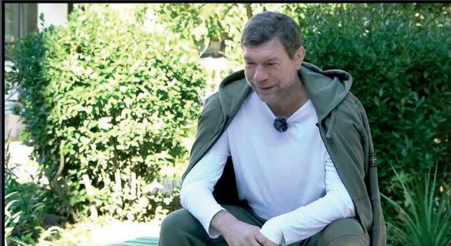
На фото слева – кандидат в Президенты Украины Олег Царев после покушения на него в 2014 году. На фото справа – Олег Царев после покушения в 2023 году.

Например, кандидат в Президенты Олег Царев подвергся публичному нападению и последующим покушениям. Призывы к нападению прозвучали публично в эфире телевидения. Никто из виновных не был наказан.