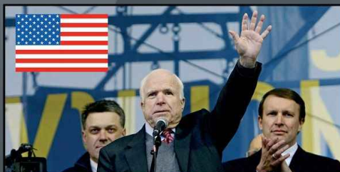
Джон Маккейн, сенатор США, председатель совета директоров Международного республиканского института на Евромайдане