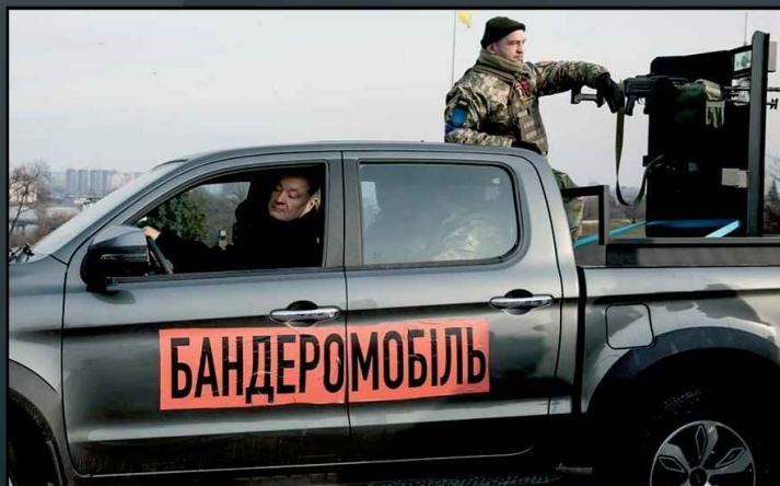
На фото слева – президент Украины Петр Порошенко в куртке с надписью «Циничный Бандера». На фото справа – президент Украины Петр Порошенко за рулем автомашины с надписью «Бандеромобиль».

Кроме того, данный закон предписывает украинскому государству «разрабатывать и совершенствовать учебные планы, учебники, программы и мероприятия с целью изучения» их истории, а также способствует «созданию мемориальных комплексов и захоронений, сооружению и восстановлению памятников, памятных знаков, увековечиванию имен или псевдонимов борцов и формирований в названиях объектов топонимики населенных пунктов или административно-территориальных единиц, названиях географических объектов, изготовление печатной, кино- и видеопродукции, содействие деятельности в отношении сценического и другого художественного воплощения образов».