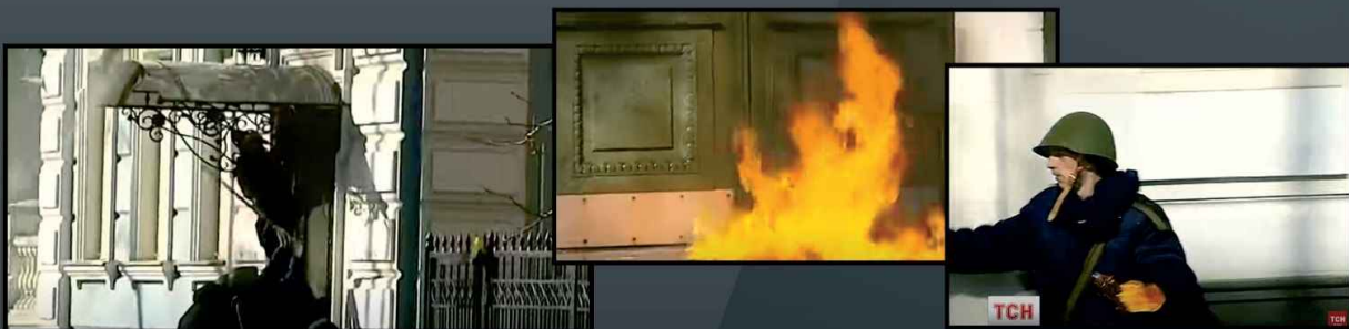
На фото – штурм и поджог офиса Партии регионов боевиками Евромайдана в Киеве в 2014 году

В соответствии с принципами украинских националистов Евромайдан широко использовал террор. Ниже приведены лишь несколько примеров из длинного списка. 24 января 2014 года около общежития в Киеве застрелен милиционер. Ответственность за его убийство взяла на себя «Украинская повстанческая армия». 27 декабря 2013 года участники Евромайдана в Херсоне убили одного и нанесли тяжелые ранения двум милиционерам. В феврале 2014 года убит судья Автозаводского районного суда города Кременчуга Полтавской области, который осудил боевиков Евромайдана, которые захватывали здание городского совета. В том же феврале 2014 года боевиками Евромайдана было совершено нападение на офис Партии регионов. Он был подожжен, один из сотрудников убит, а остальные зверски избиты.