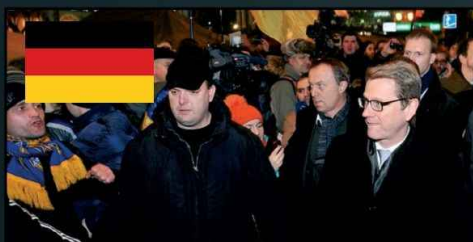
Гидо Вестервелле, бывший Министр иностранных дел Германии на Евромайдане

В 2014 году Министр иностранных дел России Сергей Викторович Лавров дал следующую оценку произошедшему: «Когда мы призывали к тому, чтобы вернуться к выполнению обязательств, взятого на себя 21 февраля, и пытались усомнить наших западных партнеров, особенно тех, кто принимал непосредственное участие в подготовке этого заявления, нам говорили, что поезд ушел, уже ситуация изменилась. Как может ситуация измениться таким образом, чтобы задача национального единства страны стала неактуальной?»