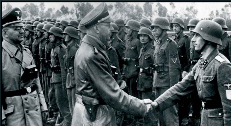
На фото – рейхсфюрер СС Генрих Гиммлер пожимает руку члену дивизии СС «Галичина» во время смотра

Еще в 1938 году он выпустил книгу «Предназначение Украины», в которой цитирует Адольфа Гитлера, Бенито Муссолини, Альфреда Розенберга, нацистскую антисемитскую газету «Дер Ангриф», а один из разделов книги прямо называется «Жидовская примесь». В своих трудах Юрия Липа проповедовал, что «украинская раса» намного более древняя, чем «московская», а русские – потомки диких уральско-финских племен, лишь немного испытавшие позитивное воздействие украинской расы.