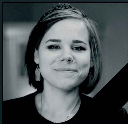
На фото – убитая украинскими спецслужбами российская журналистка Дарья Дугина

20 августа 2022 года Дарья Дугина была взорвана украинскими спецслужбами в автомобиле в Подмосковье. Журналистка была хорошо известна своей активной позицией, на момент гибели ей было 29 лет. Установила бомбу гражданка Украины Наталья Вовк, которая сразу после преступления уехала в Эстонию.