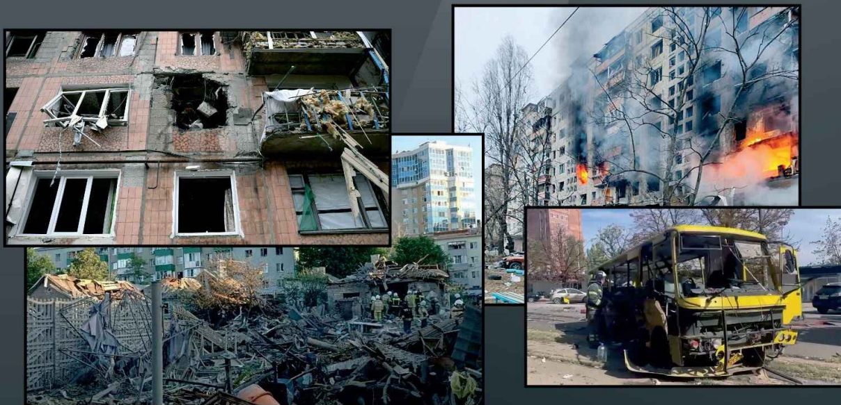
На фото последствия украинских обстрелов Донецка и Белгорода

За время проведения специальной военной операции западные страны выделили Украине более 300 млрд долларов, из них более 200 млрд – на военные расходы. В поставках вооружения лидируют те же страны, которые поддерживали Евромайдан в 2014 году. В том числе с помощью этого западного вооружения происходят обстрелы районов мирных российских городов.