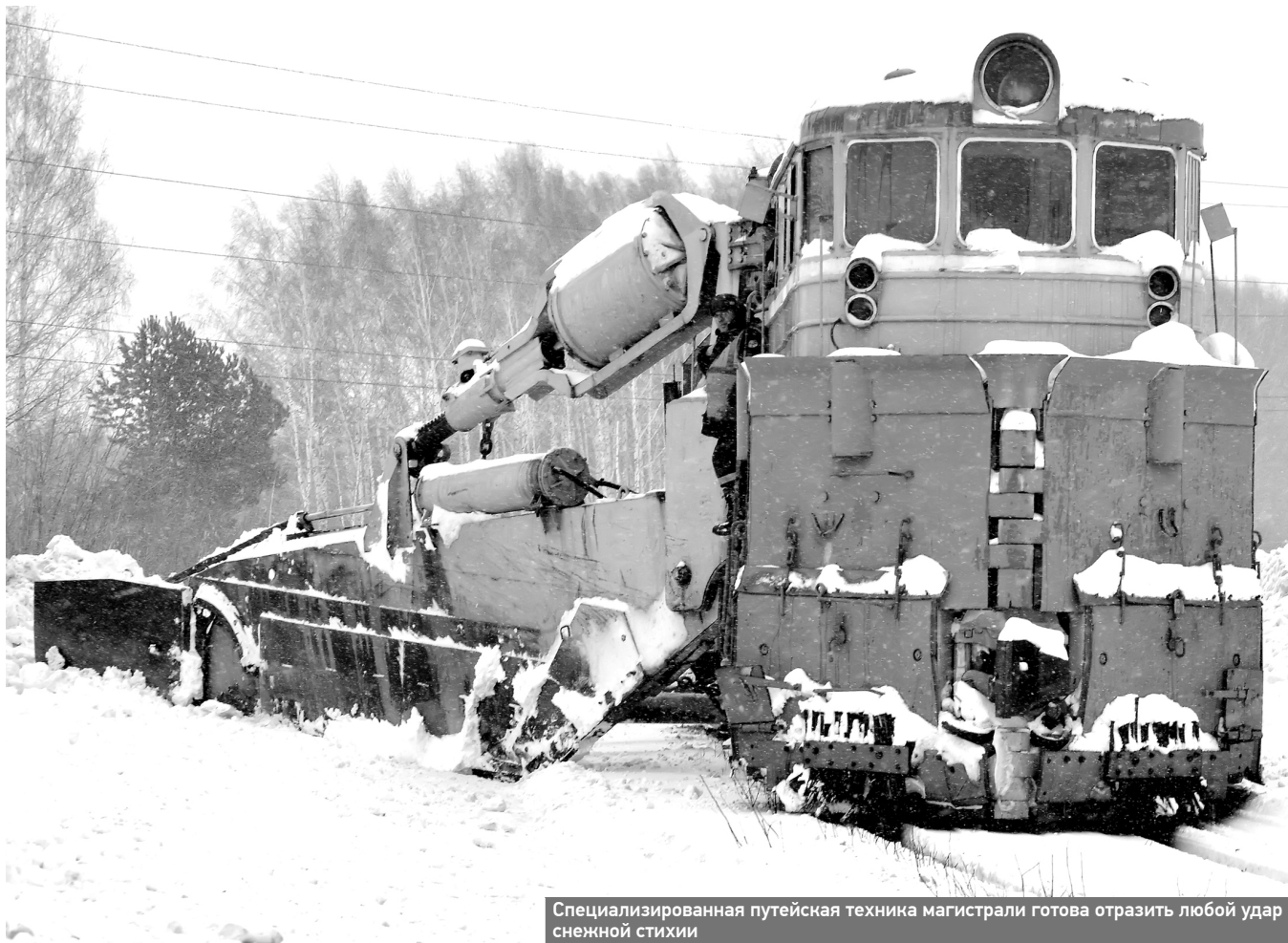
Специализированная путевая техника магистрали готова отразить любой удар снежной стихии

Железнодорожники прилагают максимум усилий для того, чтобы транспортный конвейер работал слаженно и бесперебойно