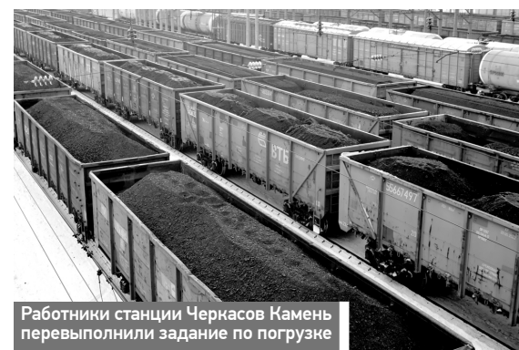
Работники станции Черкасов Камень перевыполнили задание по погрузке

По итогам отраслевого соревнования за 3-й квартал текущего года коллектив станции Черкасов Камень завоевал 2-е место.