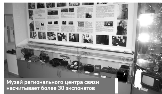
Музей регионального центра связи насчитывает более 30 экспонатов

В Алтайском региональном центре связи создан свой музей.